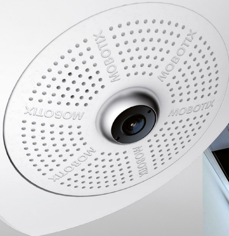
c25-100 Indoor-Kamera mit Eckmontage-Set

103° Lückenlose Raumerfassung Korrigierte Ansicht mit 103°-Premiumobjektiv (B036)